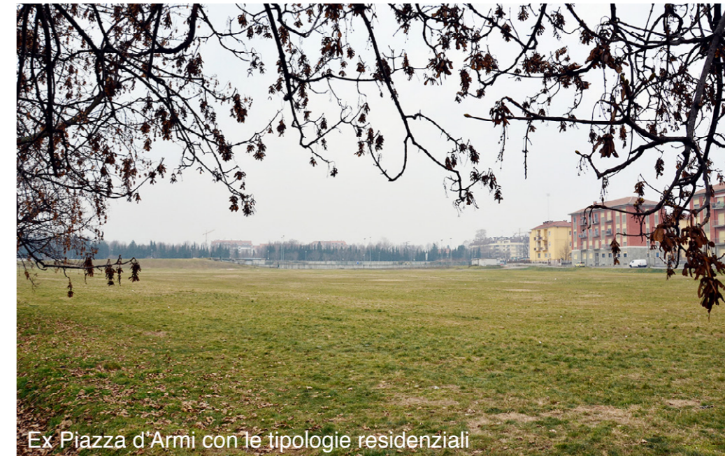
Ex Piazza d'Armi con le tipologie residenziali