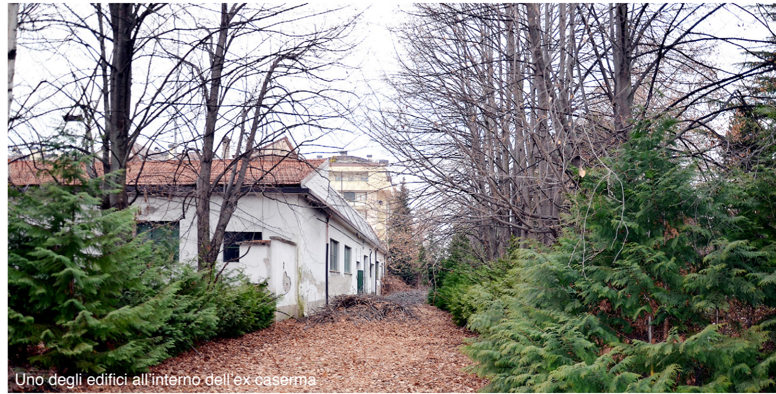
Uno degli edifici all'interno dell'ex caserma