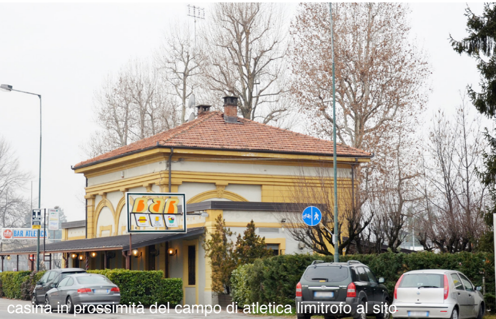
casina in prossimità del campo di atletica limitrofo al sito