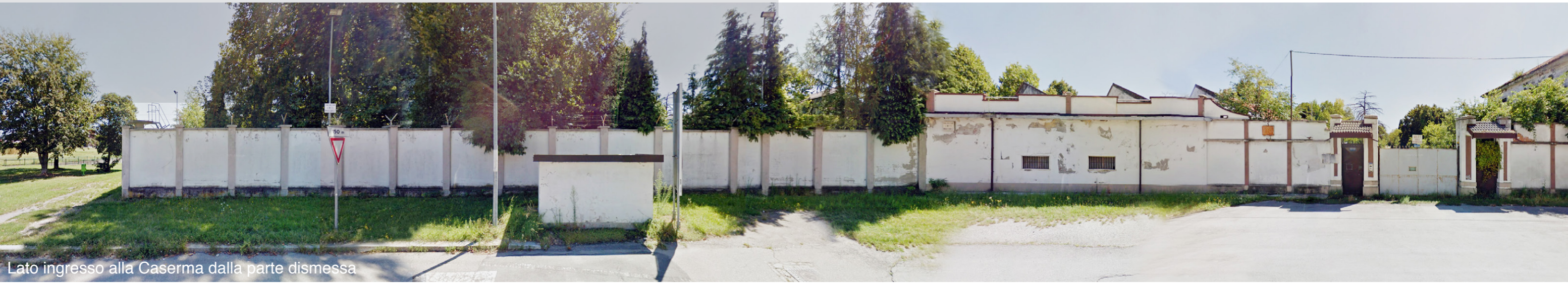
Lato ingresso alla Caserma dalla parte dismessa