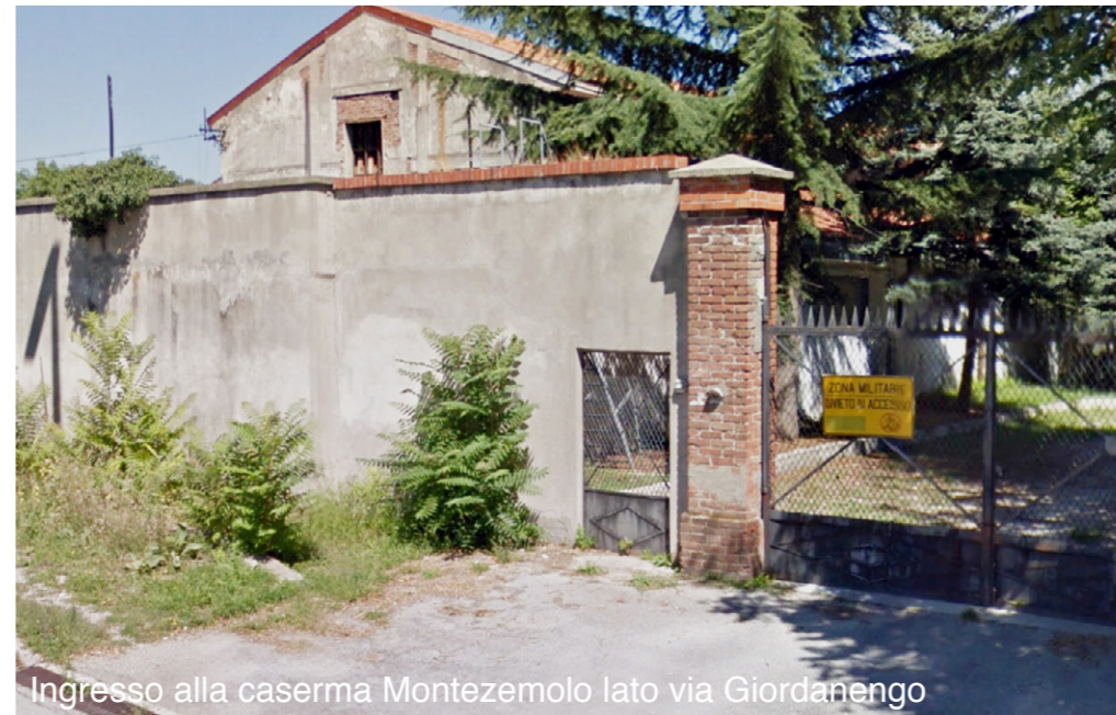
Ingresso alla caserma Montezemolo lato via Giordanengo