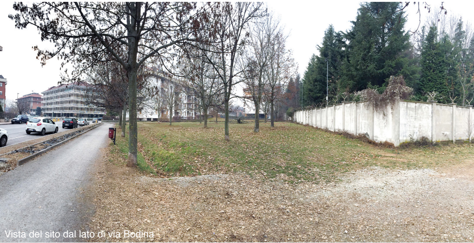
Vista del sito dal lato di via Bodina